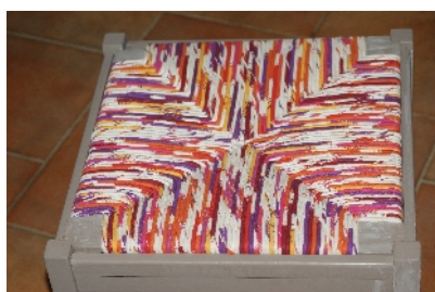
Rempaillage en tissu par Françoise