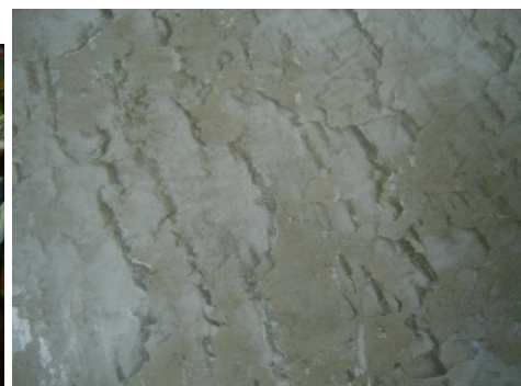
Gros plan sur Béton ciré Taupe