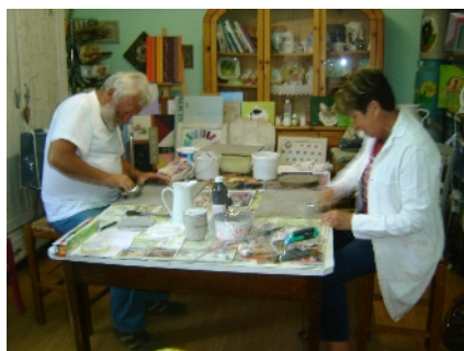
Stage Béton ciré fin mai